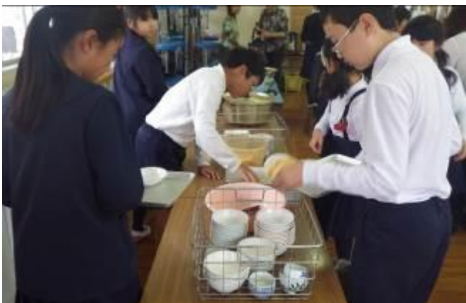
皿や箸をわけ、きれいに片づけられました。

最後に子どもを代表して、若草会や地域の方に感謝の気持ちが伝えられ、収穫祭は終わりました。