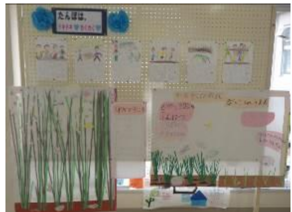
稲の成長を見守っていた様子など展示