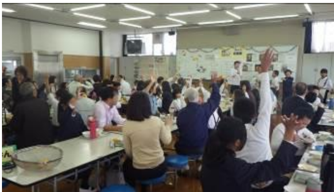
みんなでクイズに答えました！

同じ席になった子どもに感想を聞くと「お米があまい」「豚汁がおいしい」と言っていました。いつもより配膳してから食べるまで時間が経って「ご飯が冷えている」と言っている子どもがいました。いつもは、炊きたてのご飯を食べることができるなんて羨ましいことです。冷えていても、とてもおいしいご飯でした。みんな、おかわりも沢山していました。