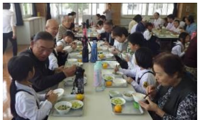
地域の方と子ども達、自然と話がはずんでいました

ごちそう様の挨拶をみんなでしました。手をあげて、おいしかったものと理由を言います。「若草会のみなさんとみんなで作った新米だから、おいしかった」と言った子どもに大きな拍手がおこりました。