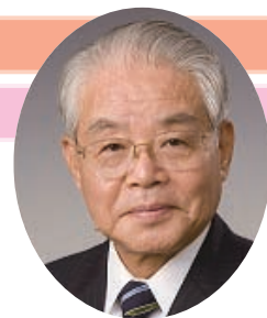
三原市長 五藤 康之