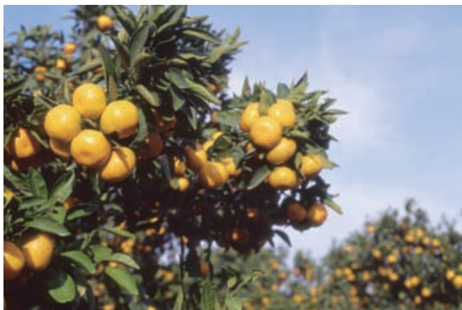
沿岸部のかんきつ