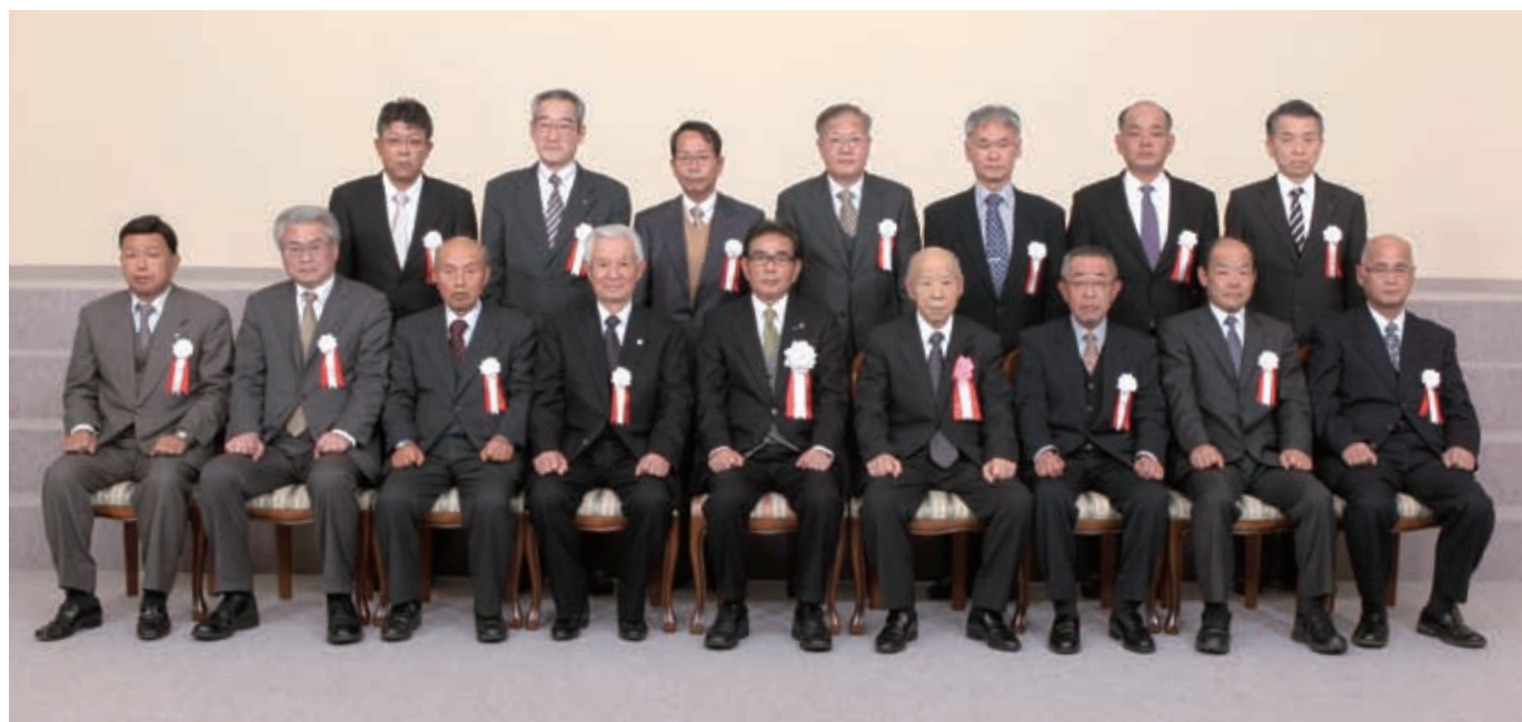
受賞者のみなさん