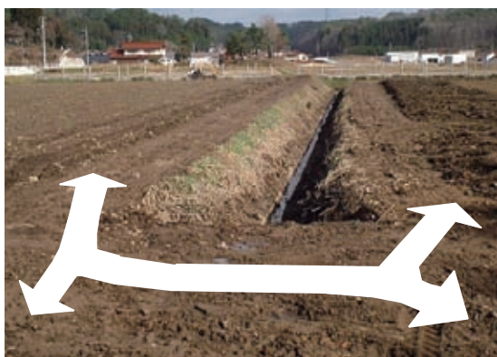
水路を挟んだ4筆に出入り可能な昇降路を設置し、連続作業が可能な畑に改良

水田を傾斜畑に転換したり、排水路や暗渠排水を施工し畑地化するなど、ほ場のきめこまやかな整備を進めています。