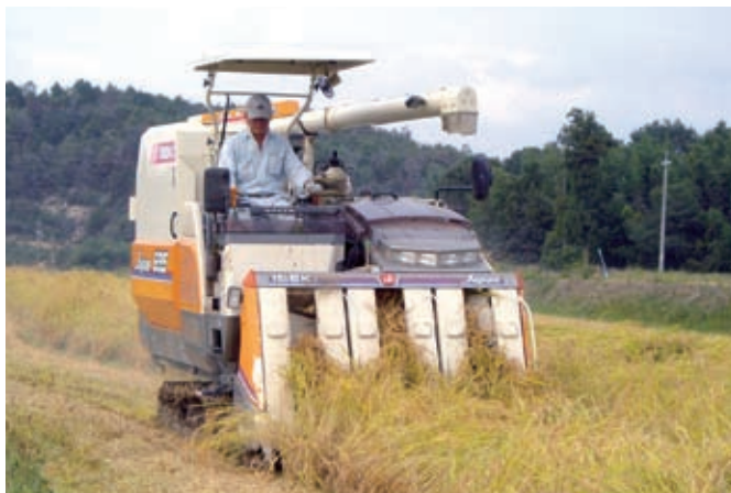
集落法人による稲の刈取作業

また、園芸作物の産地強化、拡大を図るため「新規就農者育成研修事業」、「やっさ農業塾」等により農業経営に意欲的に取り組む担い手を確保し、次世代に引継ぐことのできる農業の確立をめざしています。