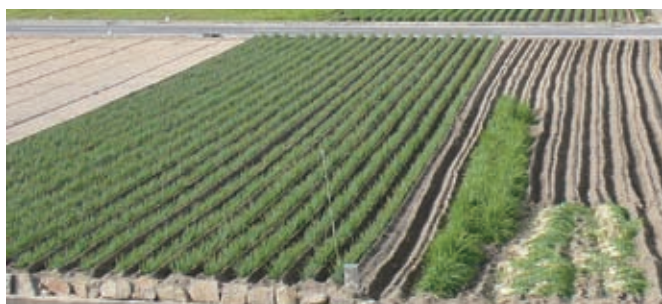
南部のわけぎ生産施設

北部地域は、畜産と水田農業の割合が高く、南部地域は温暖な気候を活かし、野菜や果樹などの園芸作物の生産が盛んで、わけぎやかんきつなど、代表的な特産物もあります。