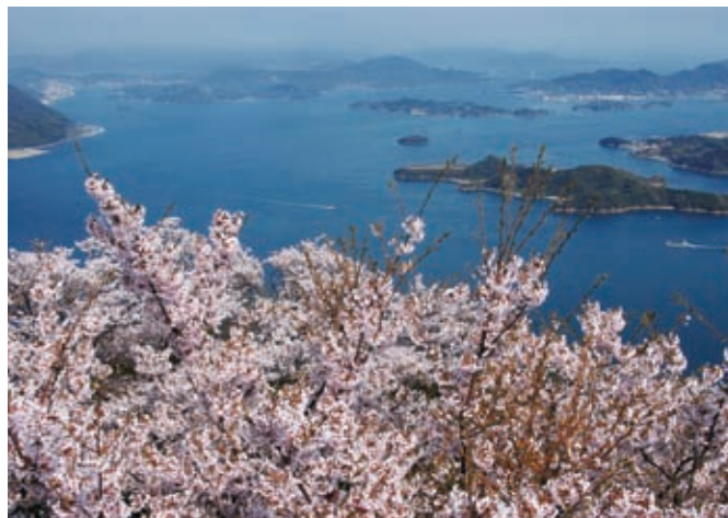
瀬戸内海国立公園 ふでがげやま りゅうおうざん 筆影山・竜王山

古くから交通の要衝として発展してきましたが、合併により広島空港、JR山陽新幹線、山陽本線・呉線、三原港、山陽自動車道、重要港湾尾道糸崎港など、陸・海・空の交通ネットワークに恵まれ、中国・四国地方の交通拠点としての役割を担っています。