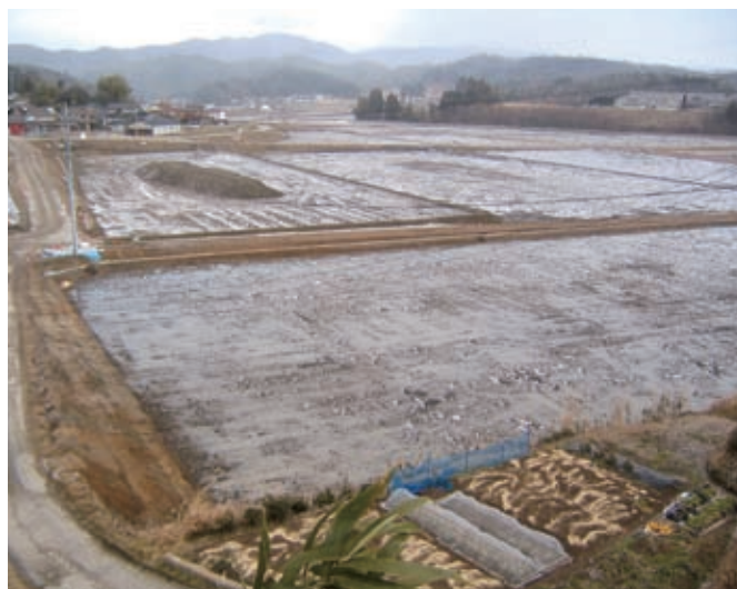
県営 ほ場整備事業 いずみきた 泉北地区

農業生産活動の維持・発展を図るため、国や県の補助事業を活用しながらほ場整備、かんがい排水事業、水田の汎用化を進めるとともに農産物直売所や学校給食及び市場等へ地元農産物を安定的に供給するため、農産物栽培用ハウス等の設置助成を行っています。