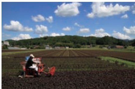
最優秀賞 テーマ：水土里あふれる景色 「特産を守る」 秋月 静枝