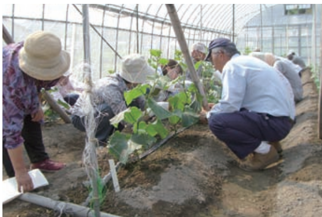
やっさ農業塾の夏野菜の実習