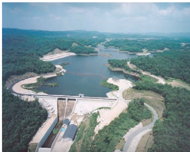
県営 水利施設整備事業 みごう 三河地区