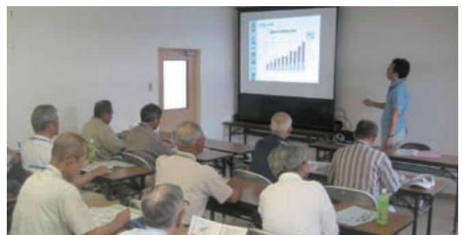
有害鳥獣対策マイスター講座の受講

イノシシなどの有害鳥獣による農作物の被害を防止するため、防護柵設置補助や狩猟に関する様々な知識や技術を身につけ、野生動物と共生するための地域、環境づくりに欠かせない人材を育成するため、有害鳥獣対策マイスター講座、集落リーダー養成講座を開催しています。