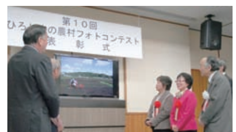
入賞作品を前に写真談義