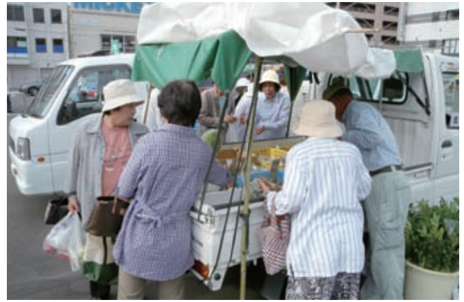
軽トラ朝市の様子

生産者と消費者のつながりの場の創出と地産地消を推進するため、商工会議所と連携し、毎月第2土曜日午前中、三原駅前市民広場で市内の農林水産業者や加工、販売グループにより、三原市産の農産物や海産物、加工品等が販売され、生産者と消費者の交流が広がっています。