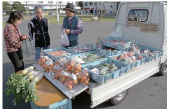
朝とりの新鮮野菜