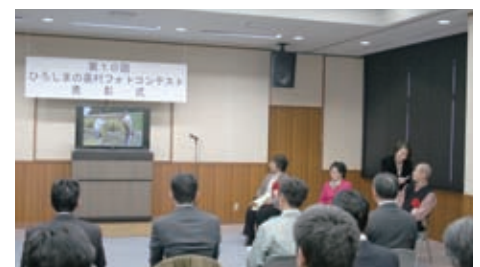
撮影時のようすについて話される受賞者のみなさん