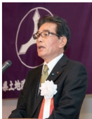
挨拶される羽田会長