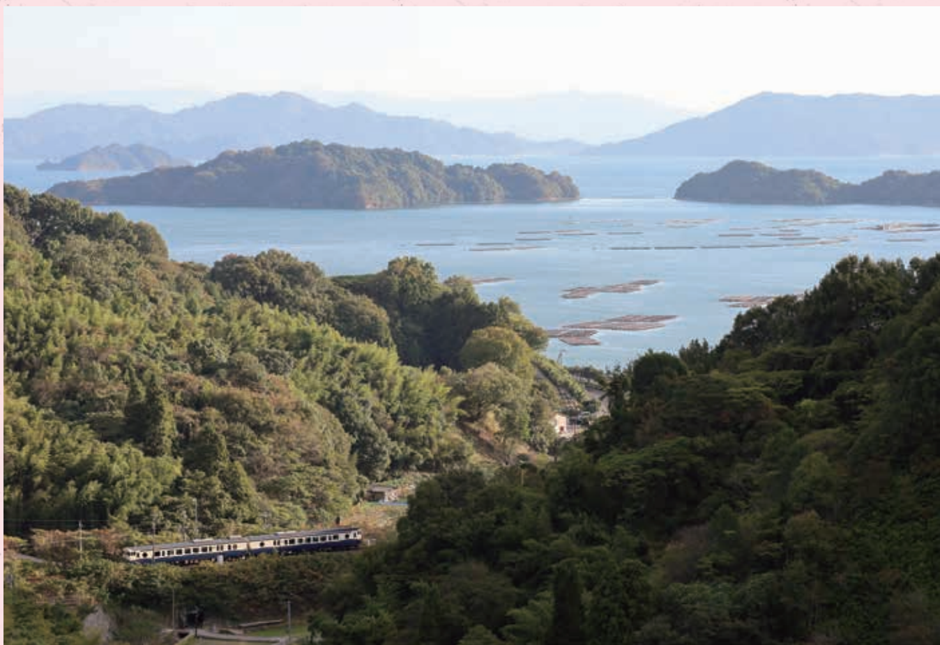
第22回ひろしまの農村フォトコンテスト 最優秀賞 「瀬戸を望む」 矢島 宏司 (撮影場所: 呉市安浦町三津口)