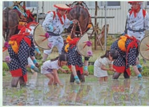
「水鏡に写る朝焼け」