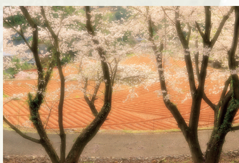
「春のジャガイモ畑」