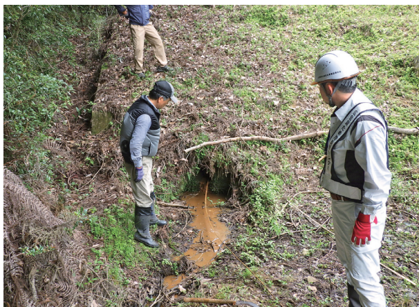
(底樋が詰まっている状況を管理者とともに確認)