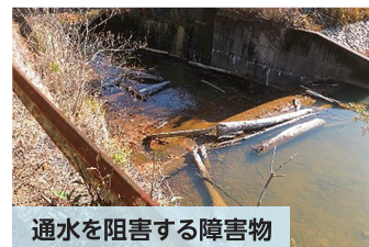
通水を阻害する障害物