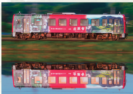
「朝日に輝く姿を映して」