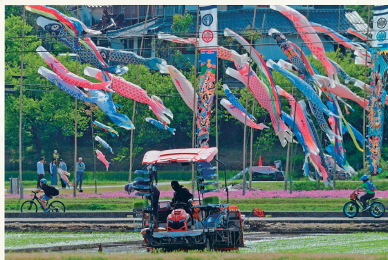
「にぎやかなゴールデンウィーク」 藤原 敏明 (撮影場所:三原市沼田東町)