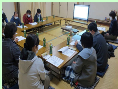
男女参画の意見交換会