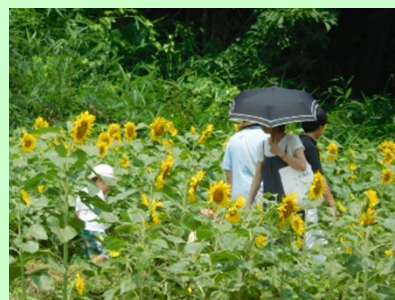
ひまわり植栽による景観形成活動